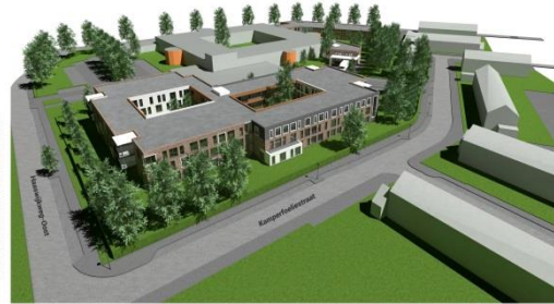
vogelvlucht GEBOUW HAASWIJKWEG-OOST

In het tweede kwartaal van 2020 wordt er gestart met de sloop van de flat en de laagbouw. Er wordt dan eerst asbest gesaneerd en daarna wordt de flat en de laagbouw middels een knijper stukje voor stukje afgevoerd, met andere woorden wordt er omgekeerd gebouwd.